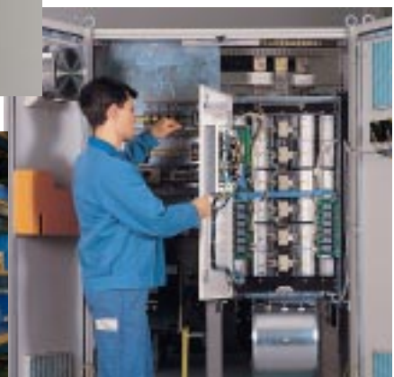
Elektroniker für Energie und Gebäudetechnik